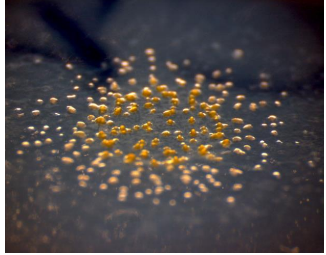
مستعمرة من بكتيريا M. xanthus تشكل أجساما ثمرية

عليها اسم الأجسام الثمرية (Fruiting bodies). تتمايز خلايا البكتيريا داخل الأجسام الثمرية الى أبواغ كروية، ذات جُدر سميكة، ومقاومة للإجهاد، حيث تبقى في مرحلة السكون لفترات طويلة، متحملة المجاعات أو أي تغير بيئي آخر مثل: درجة الحرارة والجفاف. وعندما تتحسن الظروف، وتصبح المغذيات متوفرة، تنبت الأبواغ وتتخلص من معطفها البوغي، فتتحول إلى الصورة الخضرية (Vegetative cells) من جديد.