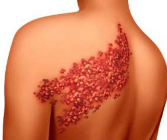
شكل يوضح البثور التي تظهر على مريض الهربس النطاقي /القوباء المنطقية (الحزام الناري) Zooster/Shingle

الناس الذين أصيبوا بجذري الماء يكونون في خطر لاحقاً في حياتهم من الإصابة بالقوباء المنطقية (الحزام الناري) عند إعادة تنشيط فيروس النطاقي/الحمائي . في بعض الحالات غير الشائعة، يمكن أيضاً أن يسبب تطعيم جذري الماء ظهور القوباء المنطقية.