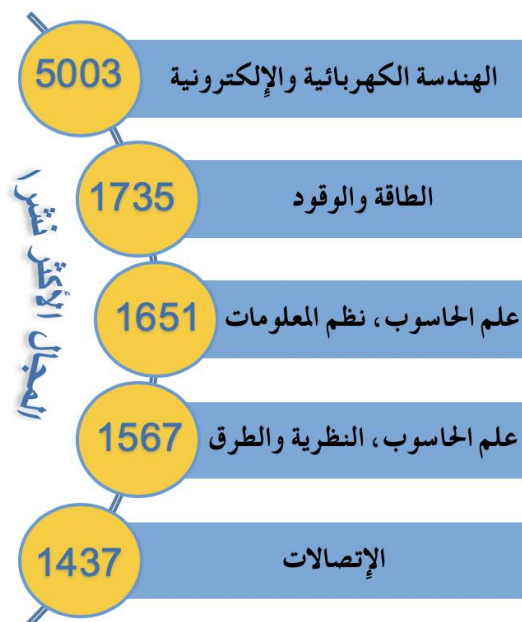
عدد الأوراق حسب سنة النشر